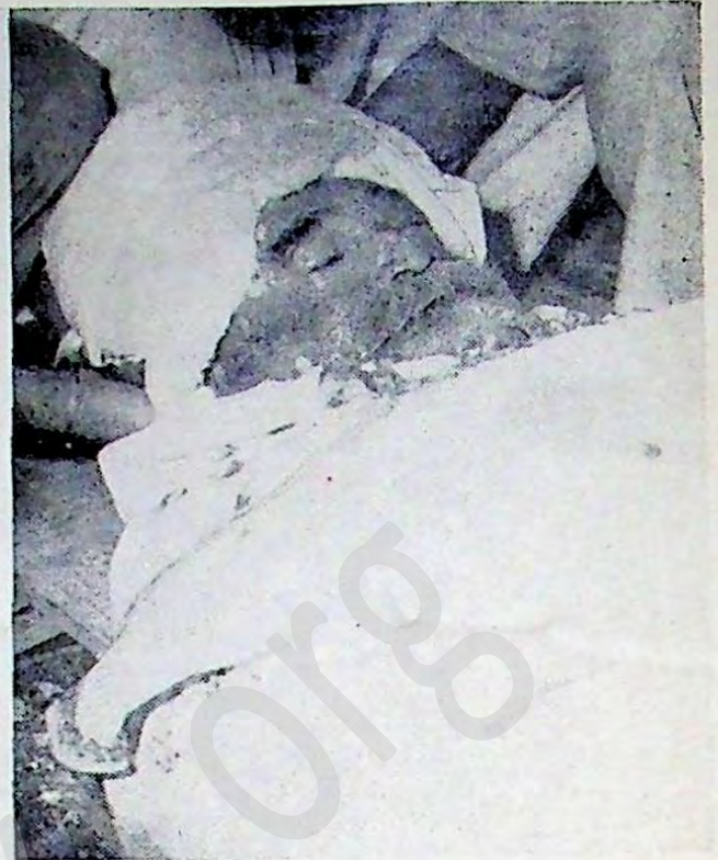
ਸ਼ਹੀਦੀ ਤੋਂ ਪਿਛੋਂ