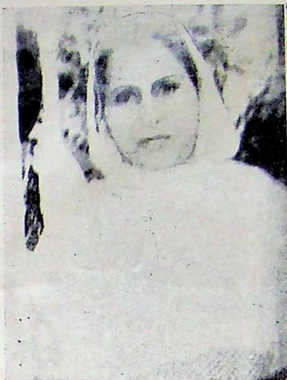
ਸ਼ਹੀਦੀ ਤੋਂ ਪਹਿਲਾਂ