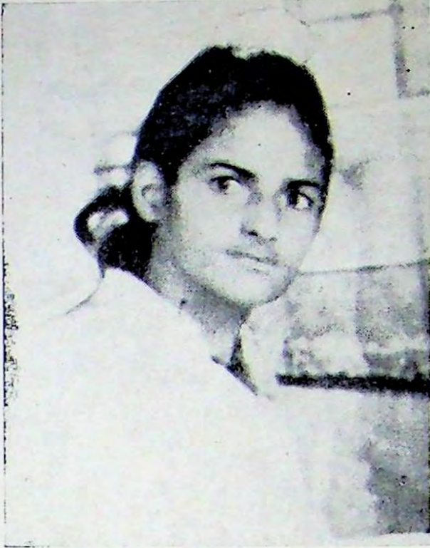
ਸ਼ਹੀਦੀ ਤੋਂ ਪਹਿਲਾਂ