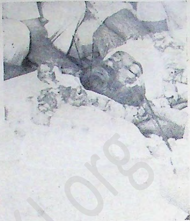
ਸ਼ਹੀਦੀ ਤੋਂ ਪਿਛੋਂ