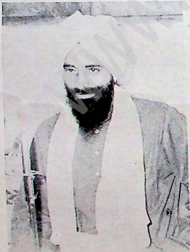
ਸ਼ਹੀਦੀ ਤੋਂ ਪਹਿਲਾਂ