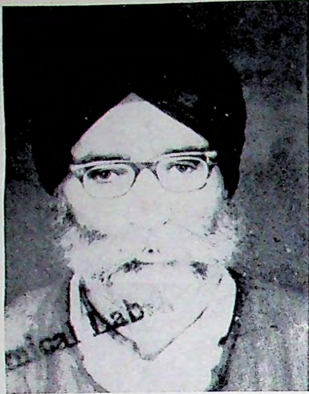
ਸ਼ਹੀਦੀ ਤੋਂ ਪਹਿਲਾਂ