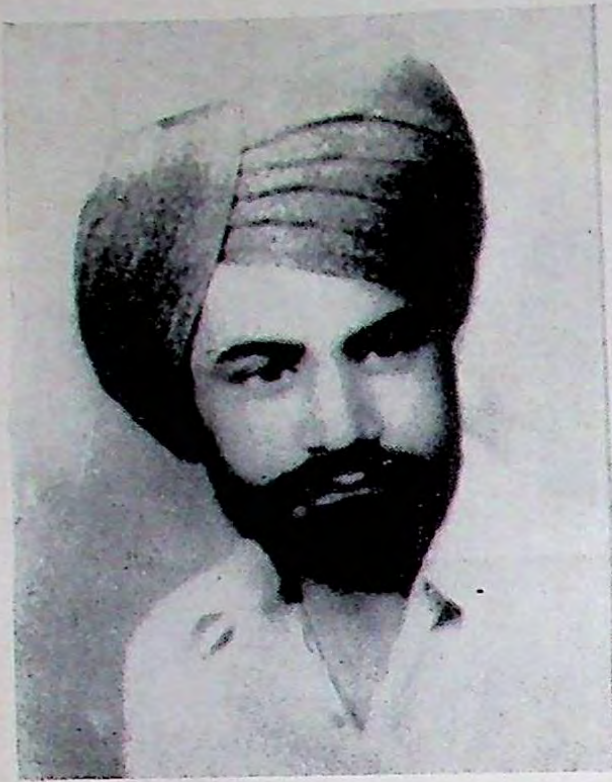
ਸ਼ਹੀਦੀ ਤੋਂ ਪਹਿਲਾਂ