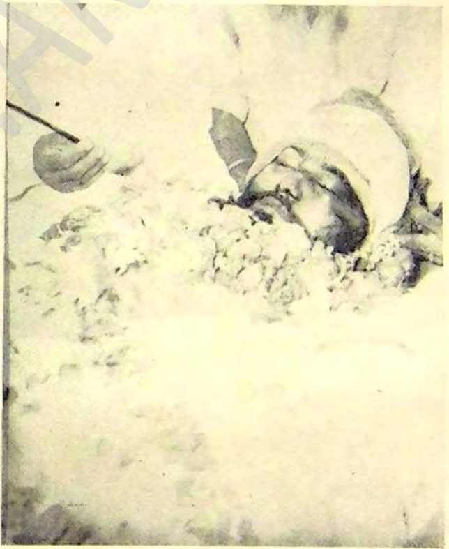
ਸ਼ਹੀਦੀ ਤੋਂ ਪਹਿਲਾਂ