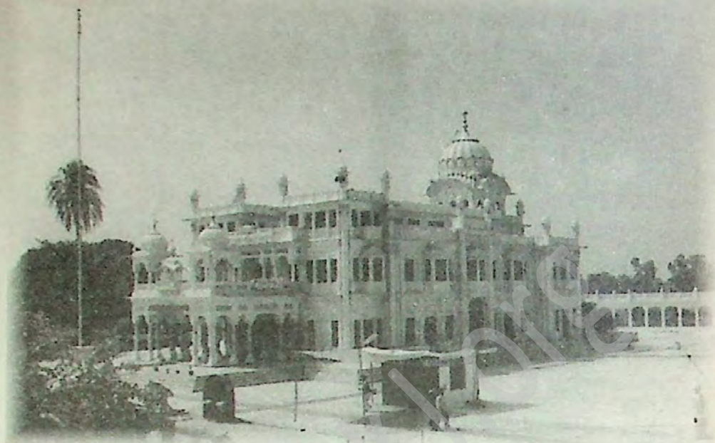
ਗੁ: ਸ੍ਰੀ ਬੇਰ ਸਾਹਿਬ ਸੁਲਤਾਨਪੁਰ ਲੋਧੀ