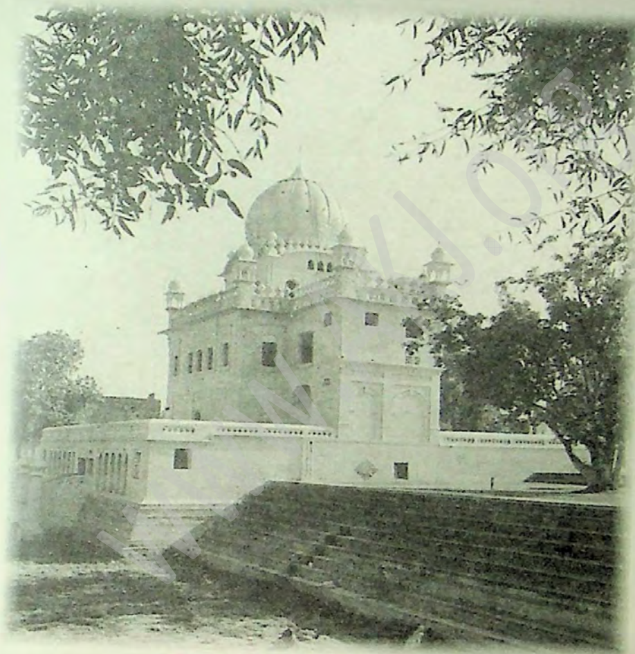
ਗੁ: ਬਾਲ ਲੀਲਾ ਸਾਹਿਬ (ਨਨਕਾਣਾ ਸਾਹਿਬ ਪਾਕਿਸਤਾਨ)