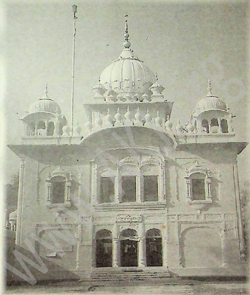
ਬਾਬਾ ਬੁੱਢਾ ਸਾਹਿਬ ਸਮਾਧ ਬਾਬਾ ਬੁੱਢਾ ਜੀ, ਰਮਦਾਸ, ਅੰਮ੍ਰਿਤਸਰ