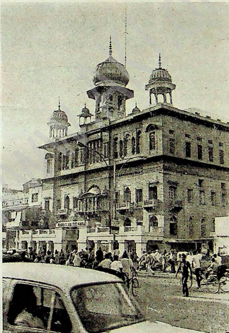
ਦਿੱਲੀ ਦੇ ਇਤਿਹਾਸਕ ਗੁਰ-ਅਸਥਾਨਾਂ ਵਿਖੇ ਅਖੰਡ ਕੀਰਤਨ ਜਥਿਆਂ ਵਲੋਂ ੭-੮-੯ ਅਕਤੂਬਰ ਨੂੰ ਕੀਰਤਨ ਸਮਾਗਮ ਅਤੇ ਰੈਣ ਸਥਾਈ ਕੀਰਤਨ ਹੋ ਰਹੇ ਹਨ ।