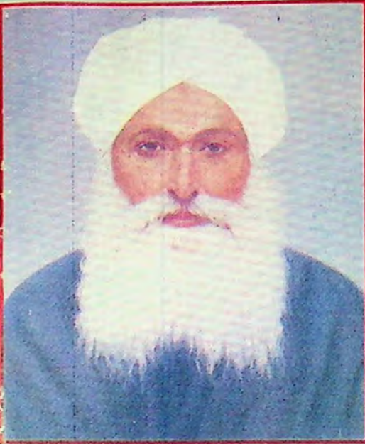
ਮਹਾਨ ਇਨਕਲਾਬੀ ਬਾਬਾ ਵਿਸਾਖਾ ਸਿੰਘ ਜੀ