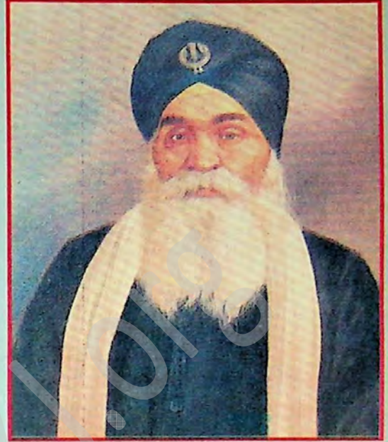
ਨਾਮ ਬਾਣੀ ਦੇ ਰਸੀਏ ਤੇ ਗੁਰਮਤਿ ਦੇ ਪ੍ਰਚਾਰਕ ਭਾਈ ਰਣਧੀਰ ਸਿੰਘ ਜੀ ਜਿਨ੍ਹਾਂ ਨੇ ਕਈ ਵਰ੍ਹੇ ਅੰਗਰੇਜ਼ਾਂ ਦੀ ਕੈਦ ਵਿਚ ਗੁਜ਼ਾਰੇ।