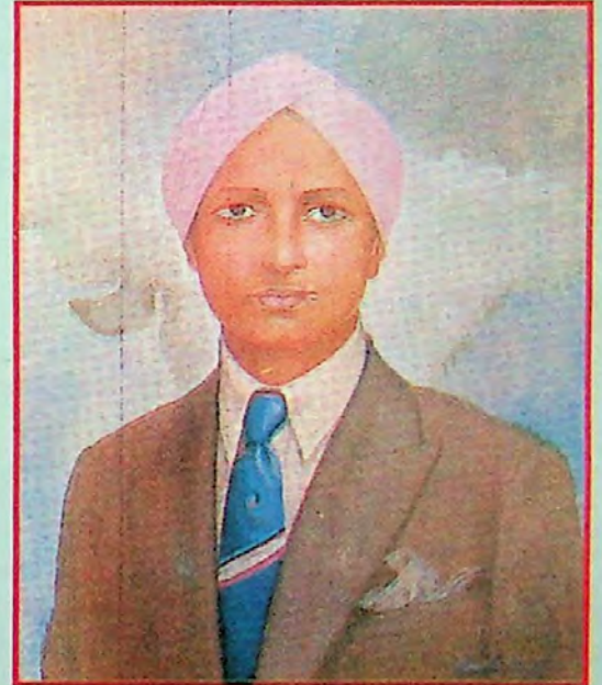
ਸ਼ਹੀਦ ਕਰਤਾਰ ਸਿੰਘ ਸਰਾਭਾ ਨੇ ਅੰਗਰੇਜ਼ ਰਾਜ ਦੀਆਂ ਜੜ੍ਹਾਂ ਹਿਲਾਈਆਂ ਅਤੇ 19 ਸਾਲ ਦੀ ਛੋਟੀ ਉਮਰੇ ਹੱਸ ਕੇ ਫਾਂਸੀ ਦਾ ਰੱਸਾ ਚੁੰਮਿਆਂ।