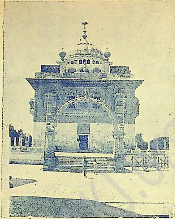
ਗੁਰਦਵਾਰਾ ਸਾਹਿਬ ਤਰਨ ਤਾਰਨ (ਅੰਮ੍ਰਿਤਸਰ) ਇਸ ਅਸਥਾਨ ਦੀ ਸੇਵਾ ਗੁਰੂ ਅਰਜਨ ਦੇਵ ਜੀ ਨੇ ਕਰਵਾਈ ਸੰਮਤ ੧੬੪੭ ਬਿਕਰਮੀ ਨੂੰ