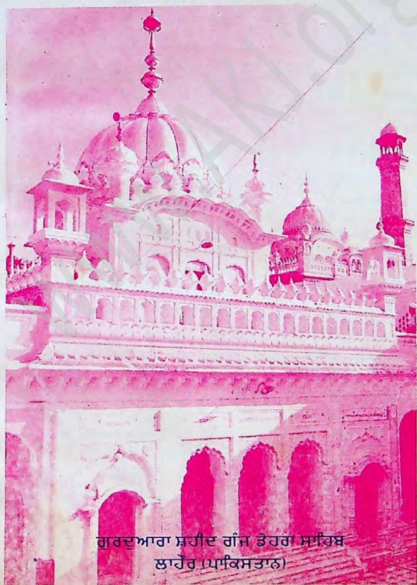
ਗੁਰਦੁਆਰਾ ਸ਼ਹੀਦ ਗੰਜ ਡੇਹਰਾ ਸਾਹਿਬ ਲਾਹੌਰ (ਪਾਕਿਸਤਾਨ)