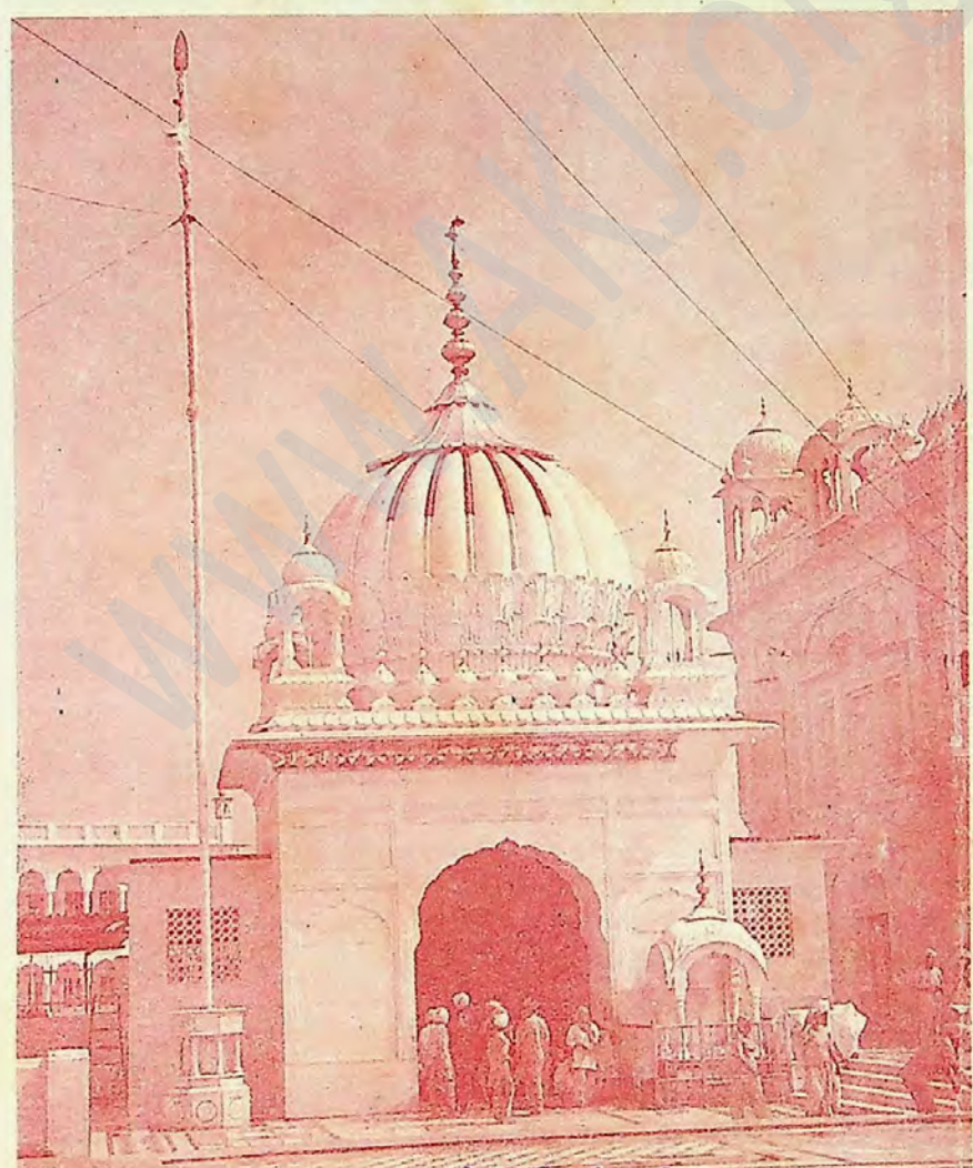
ਗੁਰਦੁਆਰਾ ਸ੍ਰੀ ਬਾਉਲੀ ਸਾਹਿਬ ਗੋਇੰਦਵਾਲ ਸਾਹਿਬ