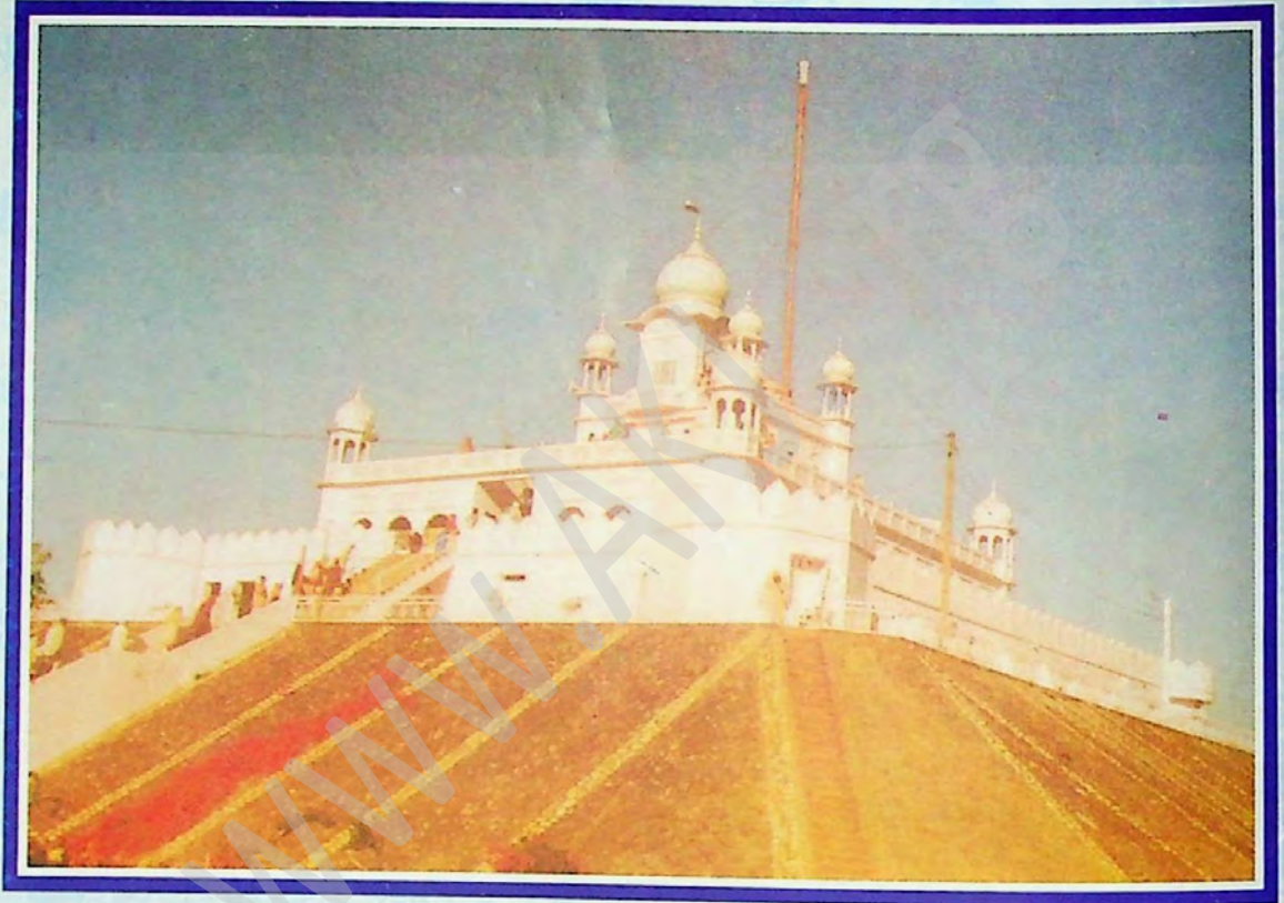
ਗੁਰਦੁਆਰਾ ਪਰਿਵਾਰ ਵਿਛੋੜਾ