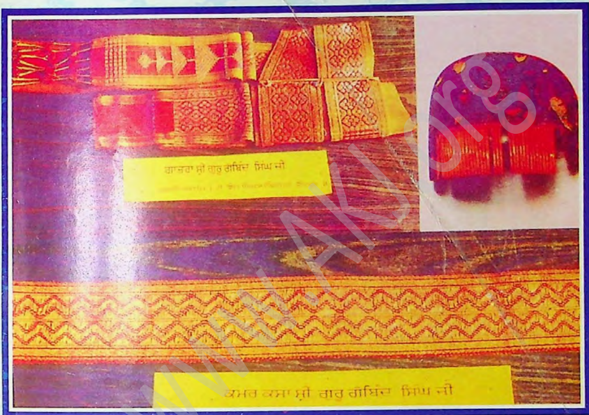
ਪਵਿੱਤਰ ਨਿਸ਼ਾਨੀਆਂ - ਗਾਤਰ, ਕਮਰ ਕੱਸਾ ਅਤੇ ਕੰਘਾ ਸ੍ਰੀ ਗੁਰੂ ਗੋਬਿੰਦ ਸਿੰਘ ਜੀ