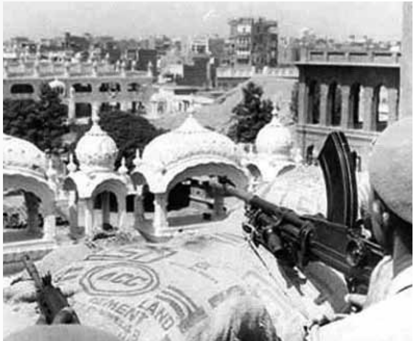
ਸ੍ਰੀ ਦਰਬਾਰ ਸਾਹਿਬ ਕੰਪਲੈਕਸ ਵਿਚਲੀ ਇਕ ਇਮਾਰਤ ਦੀ ਛੱਤ 'ਤੇ ਸਟੇਨਗੰਨਾਂ ਨਾਲ ਸ੍ਰੀ ਅਕਾਲ ਤਖਤ ਸਾਹਿਬ ਵੱਲ ਗੋਲੀਬਾਰੀ ਕਰਦੇ ਹੋਏ ਫੌਜੀ।