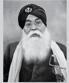
ਗੁਰਪੁਰਵਾਸੀ ਭਾਈ ਸਾਹਿਬ ਭਾਈ ਰਣਧੀਰ ਸਿੰਘ ਜੀ

ਗੁਰੂ ਦਸਮ ਪਾਤਸ਼ਾਹ ਨੇ ਵੈਸਾਖੀ ਵਾਲੇ ਦਿਨ ਖ਼ਾਲਸਾ ਪ੍ਰਗਟ ਕੀਤਾ। ਜਿਸ ਦੇ ਪ੍ਰਗਟ ਕਰਨ ਦਾ ਹੁਕਮ ਅਕਾਲ ਪੁਰਖ ਵਲੋਂ ਹੋਇਆ। ਇਹ ਖ਼ਾਲਸਾ ਅਕਾਲ ਪੁਰਖ ਦੀ ਮਉਜ ਤੋਂ ਪ੍ਰਗਟ ਹੋਇਆ ਅਤੇ ਅਕਾਲ ਪੁਰਖ ਦੀ ਅਕਾਲੀ ਫ਼ੌਜ ਕਹਾਇਆ। ਤਦੇ ਗੁਰੂ ਦਸਮ ਪਾਤਸ਼ਾਹ ਦਾ ਵਾਕ ਹੈ : ਖਾਲਸਾ ਅਕਾਲ ਪੁਰਖ ਕੀ ਫੌਜ ॥