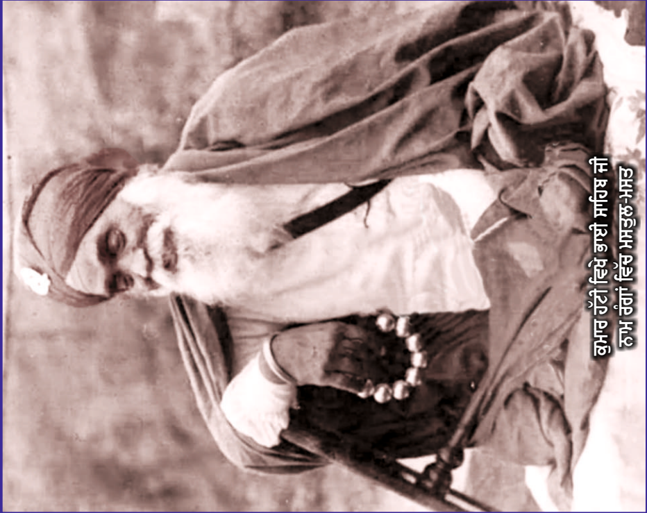
ਕੁਮਾਰ ਹੱਟੀ ਵਿਖੇ ਭਾਈ ਸਾਹਿਬ ਜੀ ਨਾਮ ਰੰਗਾਂ ਵਿੱਚ ਮਸਤੂਲ-ਮਸਤ