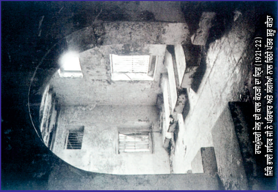
ਰਾਜਸੁੰਦਰੀ ਜੇਲ੍ਹ ਦੀ ਕਾਲ ਕੋਠੜੀ ਦਾ ਦ੍ਰਿਸ਼ (1921-22) ਜਿਥੇ ਭਾਈ ਸਾਹਿਬ ਜੀ ਨੇ ਪਰਿਵਾਰ ਅਤੇ ਸੰਗੀਆਂ ਨਾਲ ਚਿੱਠੀ ਪੱਤਰ ਸੁਰੂ ਕੀਤਾ